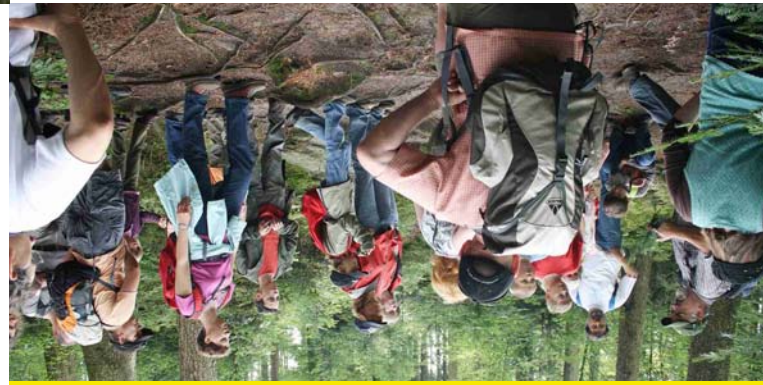
Wanderführer des Schwäbischen Albvereins

Wanderführer des Schwäbischen Albvereins Hauptgeschäftsstelle Stuttgart Hospitalstr. 21 B 70174 Stuttgart Tel. 0711 2258526 akademie@schwaebischer-albverein.de www.schwaebischer-albverein.de