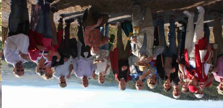
1 Landschaftsführer Landkreis Tübingen