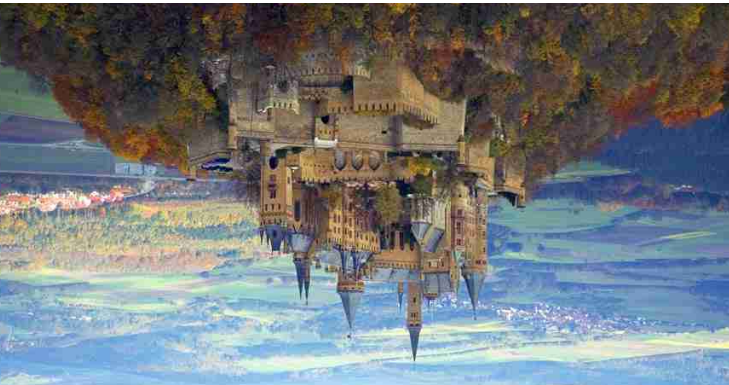
3 Alb-Guides Zollernalb